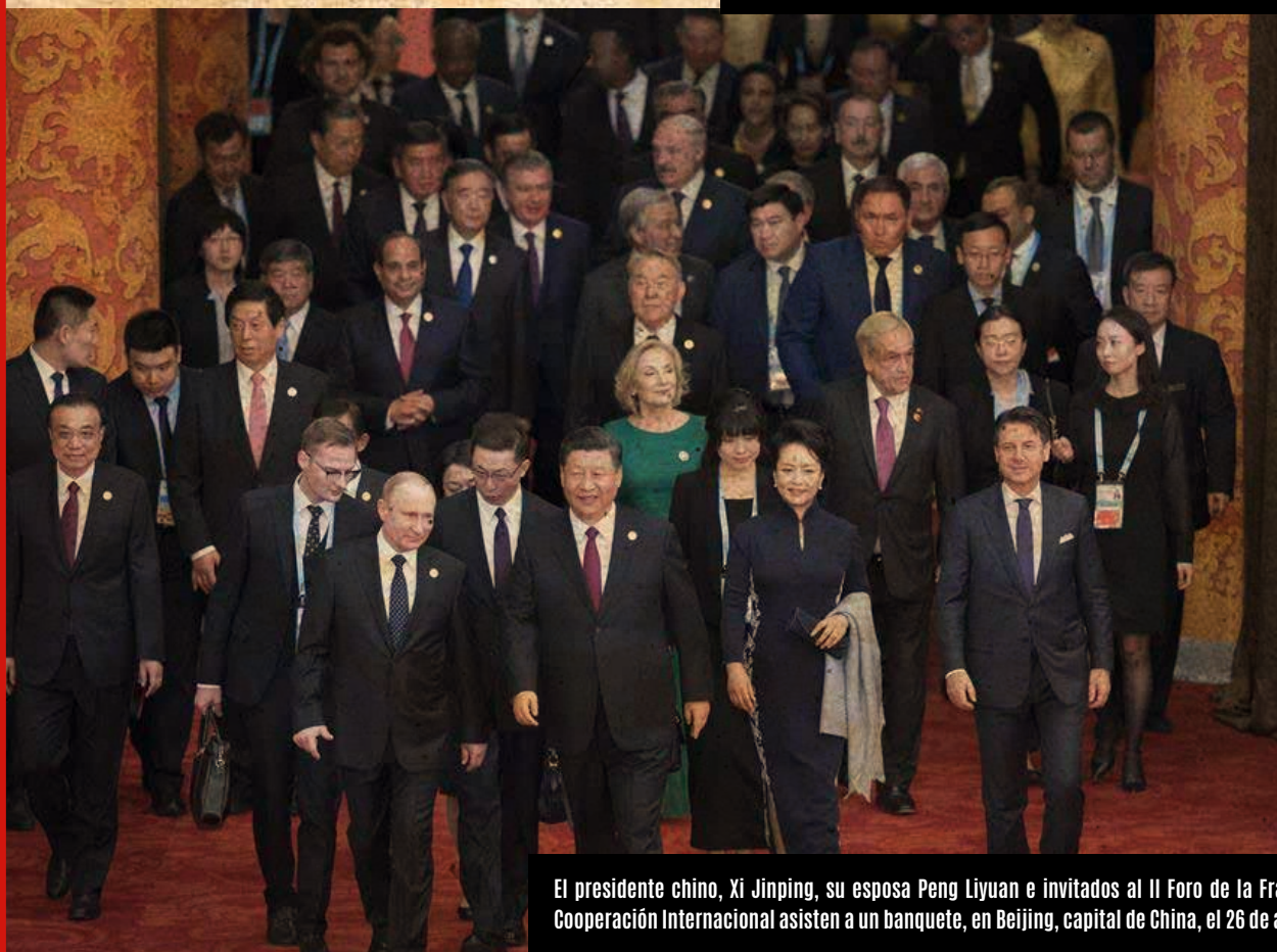
El presidente chino, Xi Jinping, su esposa Peng Liyuan e invitados al II Foro de la Franja y la Ruta para la Cooperación Internacional asisten a un banquete, en Beijing, capital de China, el 26 de abril de 2019"

(Más informaciones en https://esp.yidaiyilu.gov.cn/ )